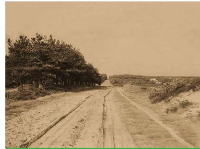
De oude Hessenweg op de Veluwe in 1925.