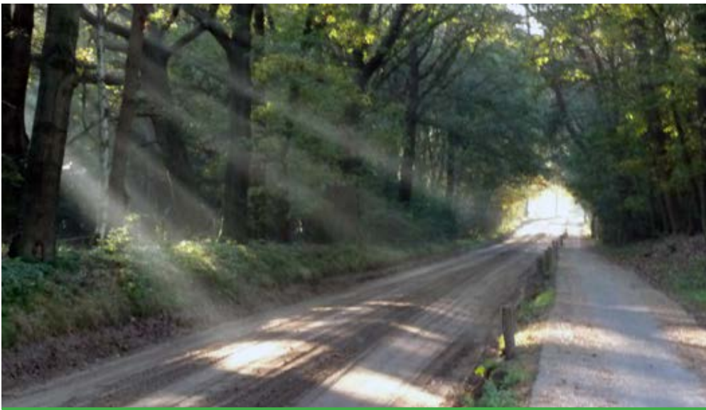
hessenweg in het Luntersche Buurtbosch

De voorwerpen in de zakjes zijn een voorbeeld van de producten die vervoerd werden: zilveren lepeltjes staan voor zilver, het porseleinen kopje met schotel staat voor aardewerk en keramiek (bijvoorbeeld uit China), de lapjes staan voor kostbaar textiel (denk aan de zijderoute), het zwartsel diende om kleding zwart te verven.