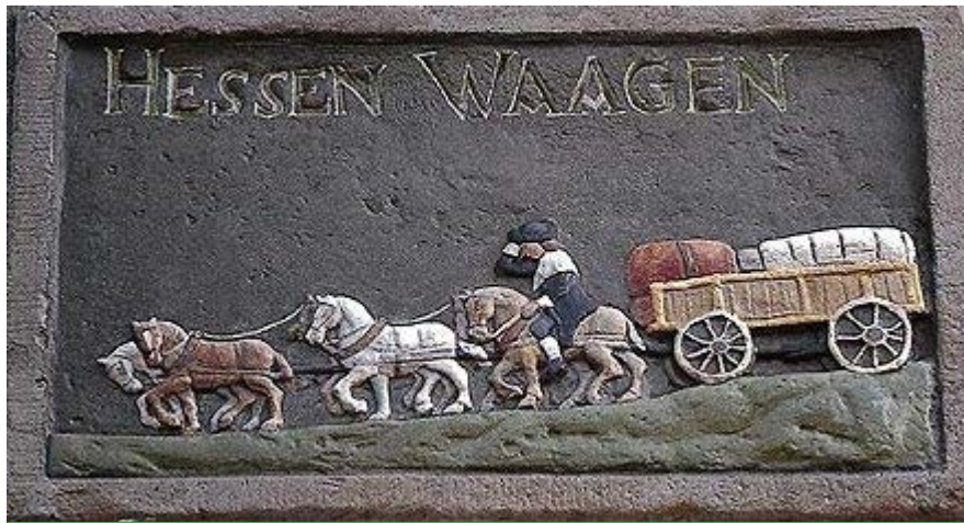
Gevelsteen Hessenwaagen Voormalige Hessenherberg in de Thomas a Kempisstraat in Zwolle.