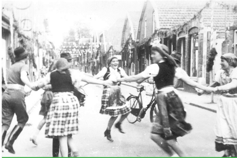
Na afloop van de optocht op Koninginnedag 1945 maken jongens en meisjes een rondedans op het Maandereind ter hoogte van de plaats waar de winkels van Hille en kapper Post zijn.

3. Fotokopieën uit een adresboek uit 1917 van Ede worden bestudeerd. Deze opdracht is vrij moeilijk. Gebruik hierbij zo mogelijk een woordenboek.