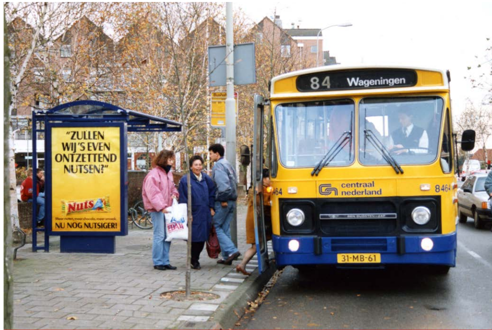
De bus bij de bushalte op de Molenstraat ter hoogte van de Markt.

Het gemeentearchief is een afdeling van de gemeente, die de documenten van die gemeente voor een groot gedeelte bewaart. Niet alleen van de gemeente zelf maar ook die van allerlei verenigingen en instellingen. Het gemeentearchief probeert zoveel mogelijk archieven van particuliere bedrijven, instellingen, verenigingen en personen te verzamelen. Op deze manier kan een zo compleet mogelijk beeld van de geschiedenis van de gemeente ontstaan.