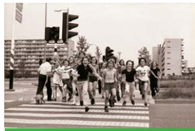
Toon Hermans school, Veldhuizen Ede.