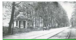
De Edeseweg voorheen de Bennekomseweg bij kasteel Hoekelum (wissel 1). Op de weg staat een man met een hondenkar.