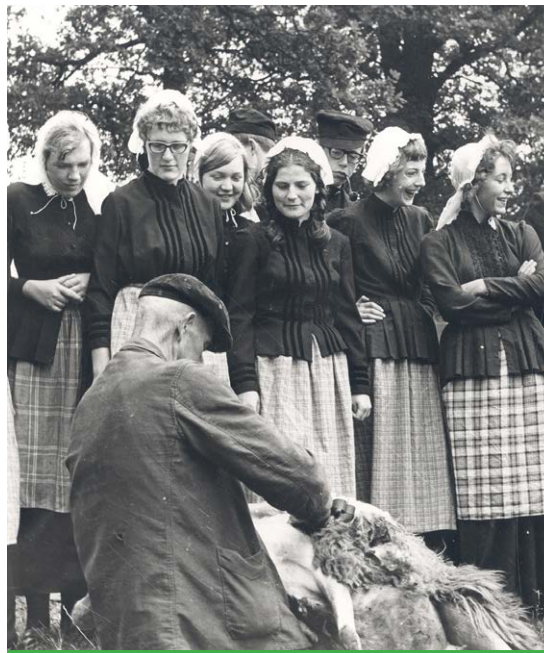
Meisjes en jongens in klederdracht staan te kijken hoe een schaap geschoren wordt.

In het archief gaan de leerlingen in groepjes met verschillende bronnen aan de slag. Zij krijgen een aantal vragen die zij met behulp van de bronnen moeten oplossen. Bronnen die worden gebruikt zijn onder meer kaarten, foto's en bouwtekeningen.