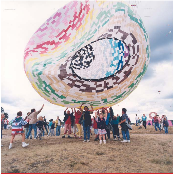
Vliegerfestijn op de Ginkelse heide tijdens de Heideweek.