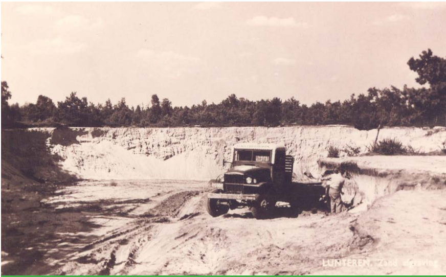
In de omgeving van Lunteren waren zand- en grindafgravingen. Na de Tweede Wereldoorlog werden paard en wagen vervangen door afgedankte legervoertuigen. Het laden moest nog wel met handkracht gebeuren.