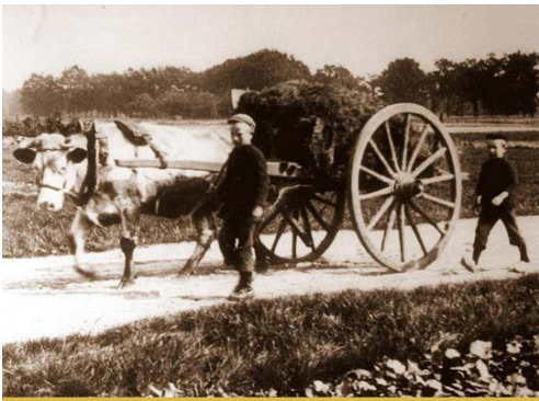
Boerenkar met koe

Ik zou zo graag een koeike kopen Annemarie-Katrien-Katrien Ik zou zo graag een koeike kopen Annemarie-Katrien