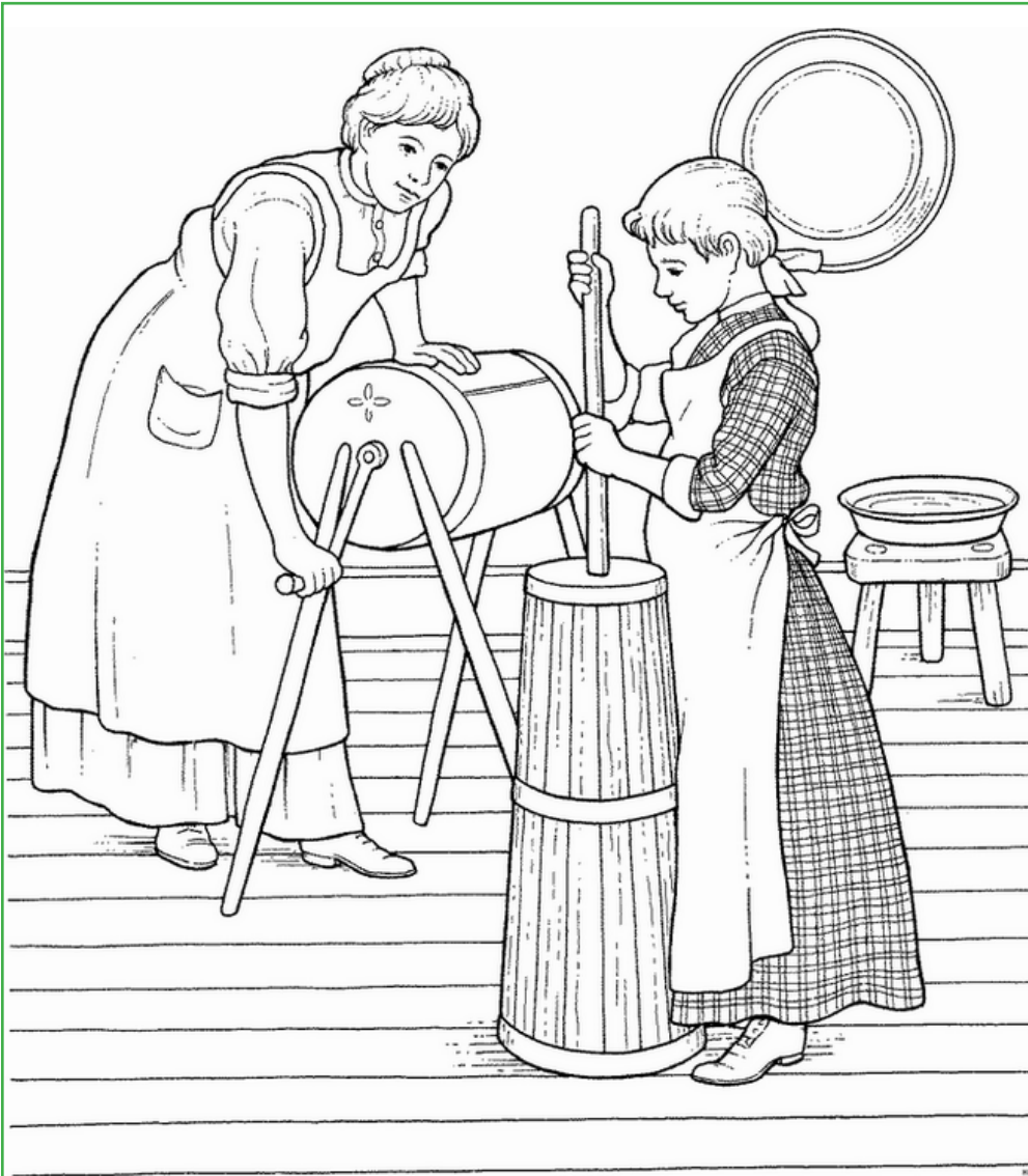
Kleurplaat boter maken

Een bezoek met uw klas aan het Kijk en Luistermuseum sluit aan op de Erfgoedleerlijn Ede bij het thema VOORWERPEN EN GEBRUIKEN leven in de tijd van TOEN voor groep 1 t/m 4.