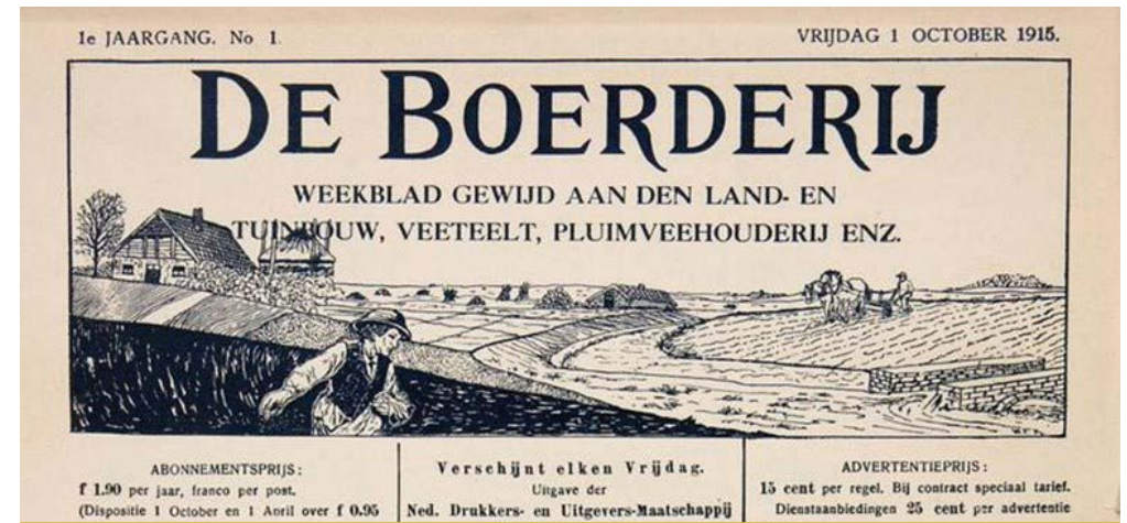
Stukje uit het weekblad de Boerderij